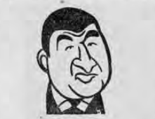
SALINGER ... La Casa Blanca informó sobre importante reunión...

Salinger dijo que el Embaja- do en las Naciones Unidas Ad- lai E. Stevenson y el negocia- dor Especial para la crisis Mr Cloy presentaron informes. Los otros que tomaron parte en la reunión eran los planificadores