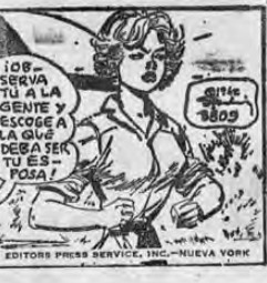
EDITORS PRESS SERVICE, INC. - NUEVA YORK