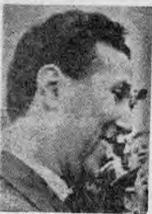
BEN BELLA: ... no reparte tierras: el estado las controla...

ARGEL, 12 (AP) — El pró- mer ministro Ahmed Ben Bella terminó hoy una gira por la por- ta región oriental del país en donde se hizo frente a la terea autonómica de los guerrilleros bar- beriscos y al creciente disguste to de los hambrientos campesi- nos.